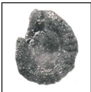
Fig. 2. Spaanse peper of paprika (10x vergroot).

Capsicum annuum , de spaanse peper of paprika (zie fig. 2), is in de gehele periode vanaf 400 AD slechts één maal eerder in ons land gevonden, en wel in het Agnietenklooster in Leiden. Het betreffende monster heeft een datering tussen 1500 en 1600 AD, vrijwel gelijktijdig met het monster uit de Bierstraat (1550-1620). Deze soort is van origine een zuidamerikaans gewas, dat dus pas na de terugkeer van Columbus (1493) in Europa verwacht kan worden. Omdat de consumptie ook nog tot ons gebied moest doordringen, kan gesteld worden dat beide vondsten zeer vroeg zijn.