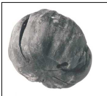
Fig. 1. Tamme kastanje (2x vergroot).

Van de granen wordt rogge het talrijkst aangetroffen, in 34 monsters uit de periode 1500-1700 AD zijn zaden (graanvelletjes/zemelen) of pollen gevonden. Gierst is ook vrij algemeen gegeten, getuige het voorkomen in 20 monsters uit de betreffende periode. Opvallend is dat tarwe slechts in vijf andere monsters uit de 16 e -17 e eeuw aangetoond is. Dit is deels te wijten aan de slechtere herkenbaarheid van de zaadhuid vergeleken met rogge, maar ook geldt, dat tarwe een veel duurdere graansoort was dan rogge. Gekweekte haver komt in negen monsters voor. Deze is nog een stuk moeilijker te herkennen, het voorkomen van haver is daardoor moeilijk op zijn waarde te schatten. Rijst heeft wel heel goed herkenbaar kaf, toch is ook deze soort maar in tien monsters uit de behandelde periode gevonden. De Romeinen kenden dit gewas ook al, maar het zal om klimatologische redenen nooit in ons land verbouwd zijn. Voor rijst uit Kampen, eveneens uit de zestiende eeuw, kon import uit het Middellandse Zeegebied worden aangetoond (zie Brinkkemper & Vermeeren, in voorb.). Het laatste stapelgewas, boekweit komt ook zeer algemeen voor in deze periode, in maar liefst 41 monsters zijn de zaden aangetroffen. Uit schriftelijke bronnen blijkt dat boekweit vanaf de veertiende eeuw bij ons in cultuur was, maar pollendiagrammen lijken aan te geven dat hier al in de twaalfde eeuw sprake van was (Van Haaster, in druk).